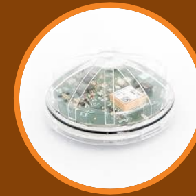
ZHAGA SMART CONTROLLER