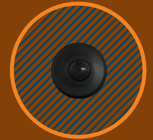
ZHAGA Motion Sensor