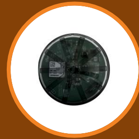
ZHAGA SMART CONTROLLER WITH GPS - LUXSENSOR-ASTRO- CLOCK